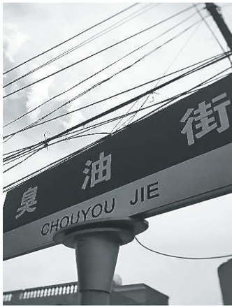
三亚臭油街街道指示牌。

“千年古盐田”的开拓者,偶然间看到这一片海滩上的海石留有自然形成的日晒盐,猛然发现了谋生之路,于是在此开山辟石,将海边天然的火山岩石削掉一半,做成盐槽,再利用烈日暴晒制盐。随后,人们陆续来此建造家园和盐田,终形成“盐田村”。