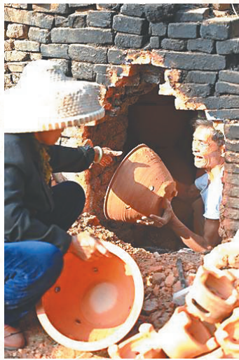
琼海嘉积镇一土窑窑主在烧制“聚宝盆”迎新年。

时代沧桑变化,很多古老的谋生手段已经湮没在岁月之中,老百姓的生存状态也已经发生天差地别的改变,但透过村名,或许可以窥见千百年前村庄独特的风韵。