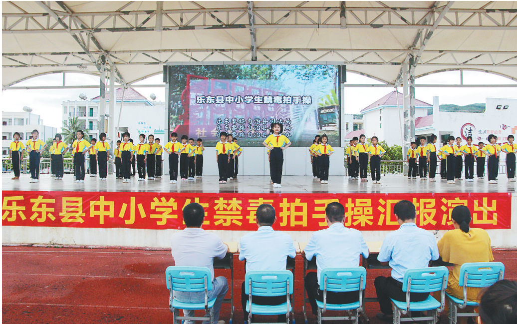
乐东举办中小學生禁毒拍手操汇报演出。