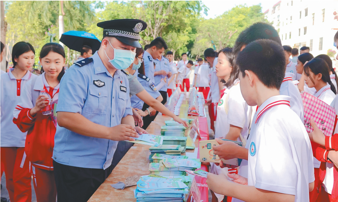
乐东民警向学生发放禁毒宣传资料。