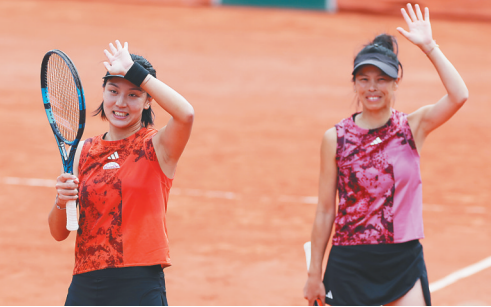
6月7日，在2023法国网球公开赛女子双打四分之一决赛中，王欣瑜（中国）/谢淑薇（中国台北）以2比0战胜俄罗斯组合库德梅托娃/萨姆索诺娃，晋级半决赛。图为王欣瑜（左）/谢淑薇庆祝胜利。