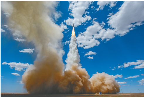
发射现场。 新华社酒泉6月7日电（李国利 郭龙飞）6月7日12时10分，力箭一号遥二运载火箭在我国酒泉卫星发射中心成功发射升空，采取“一箭26星”方式，将搭载的试验卫星顺利送入预定轨道。这批卫星主要用于技术验证试验和商业遥感信息服务。这次任务是力箭一号运载火箭第2次飞行。