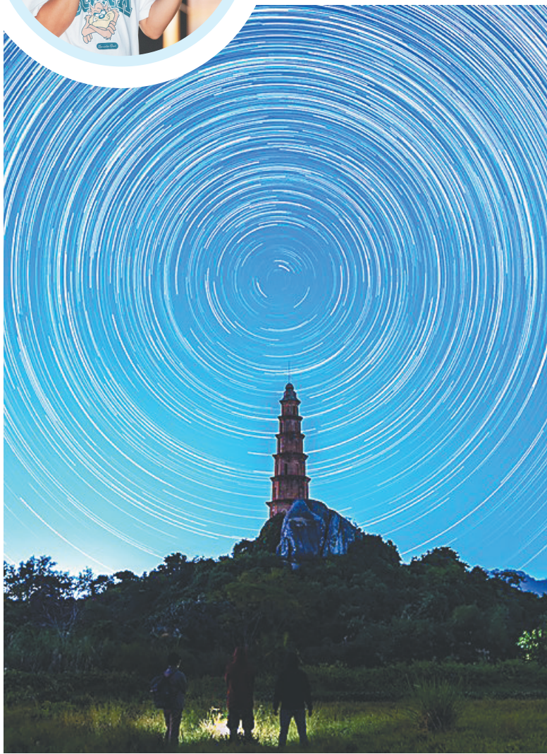
李永青摄影作品《青云塔大星轨》。 本版图片均由受访者提供