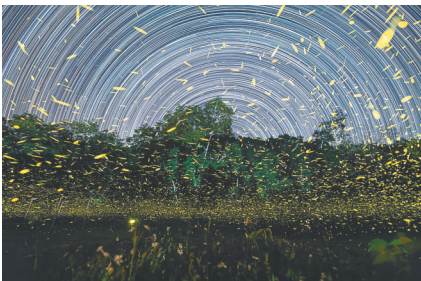
李永青摄影作品《萤火虫与星辰》。