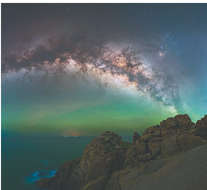
李永青拍摄的星空。