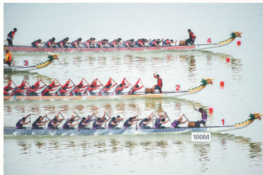
2022年6月3日，一场龙舟赛在屈原故里湖北秭归县举行。

周推翻商朝后，周天子分封诸侯，各诸侯国有了自己的姓氏，其中逐渐强大起来的楚国以“芈”为姓、以“熊”为氏。大家在先秦题材电视剧中看到不少芈姓角色，比如《芈月传》中的芈月、芈姝等，都是楚国公主。有意思的是，当时男性只能称氏不能称姓，所以楚王的称谓以“熊”开头。屈原是楚武王熊通之子屈瑕的后代，自然也是以“芈”为姓、以“熊”为氏。但由于熊氏已经被楚国王室专用了，屈氏家族就不能用“熊”了。那么屈氏家族的“屈”姓是怎么来的呢？