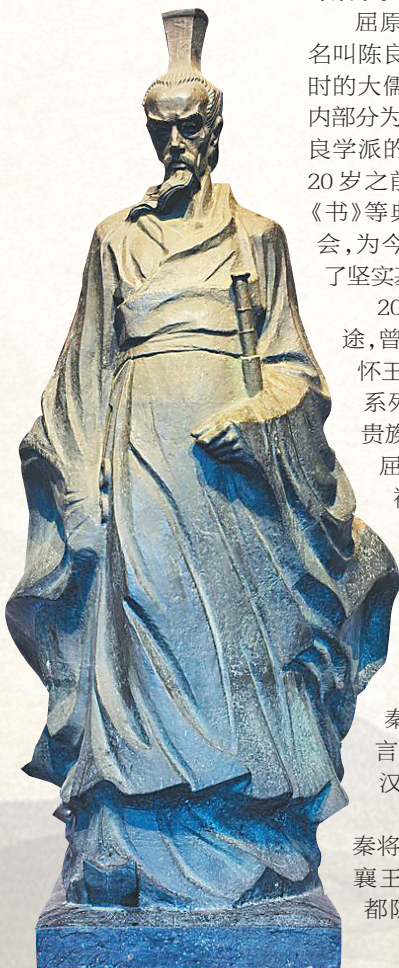
屈原雕像。本版图片除署名外均为资料图