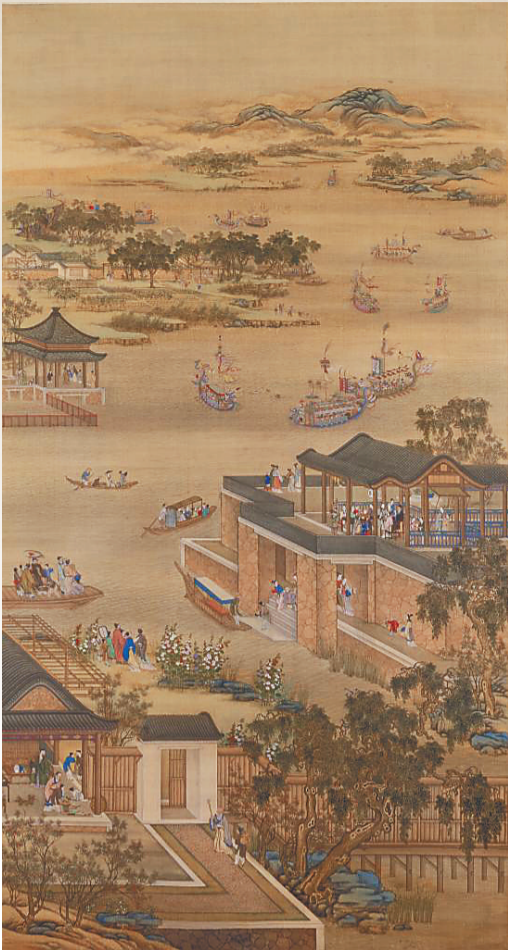
《雍正十二月行乐图之五月竞舟》。 故宫博物院藏

历来端午,总是隆重热闹而又温情。在海南人心中,端午节除拜神祭祖、祈福驱邪之外,又承载着浓厚的团聚之情。在传统村落,人们还会在端午节前夕汇聚一方,长者于房前屋后行驱五毒仪式,妇女闲谈捆扎粽子,幼童嬉戏点雄黄、洗龙水。