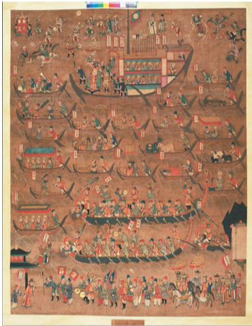
《龙舟大神宝像图》。海南省博物馆藏

水陆画最早可追溯到三国时期,是在佛教寺院、道观庙堂等场所举行水陆法会时供奉的一种宗教人物画,也是中国传统人物画的艺术形式之一。水陆法会是“三教合一”大背景下产生与发展