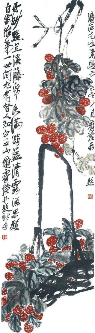
齐白石画作《香满筠篮》。