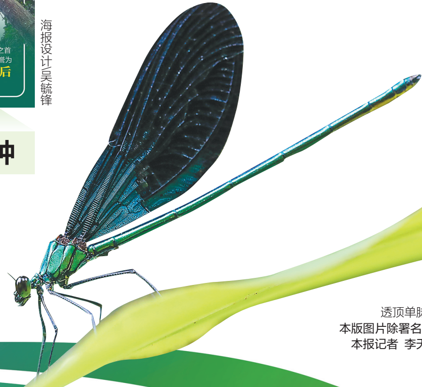
透顶单脉色螳。