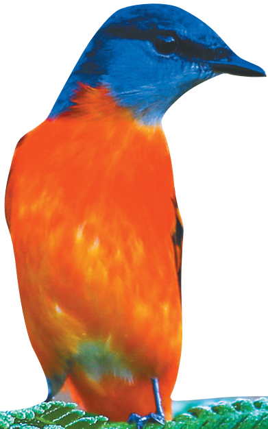
雄性灰喉山椒鸟停留在桫欏叶片上。

在发布会上，省林业局总工程师、新闻发言人周亚东介绍，此次活动时间跨度为6月至12月，以“珍惜热带雨林，醉享雨林时光”为主题，在海南热带雨林国家公园一般控制区和周边雨林景区、景点，科学合理组织开展生态旅游、游憩体验、休闲体育、科普教育和国际研讨会等系列活动，挖掘国家公园文化、传播国家公园理念、普及热带雨林知识，引导社会各界认识雨林、感受雨林、爱护雨林。 为期六个月的体验活动，吸引力何在？都有哪些亮点？