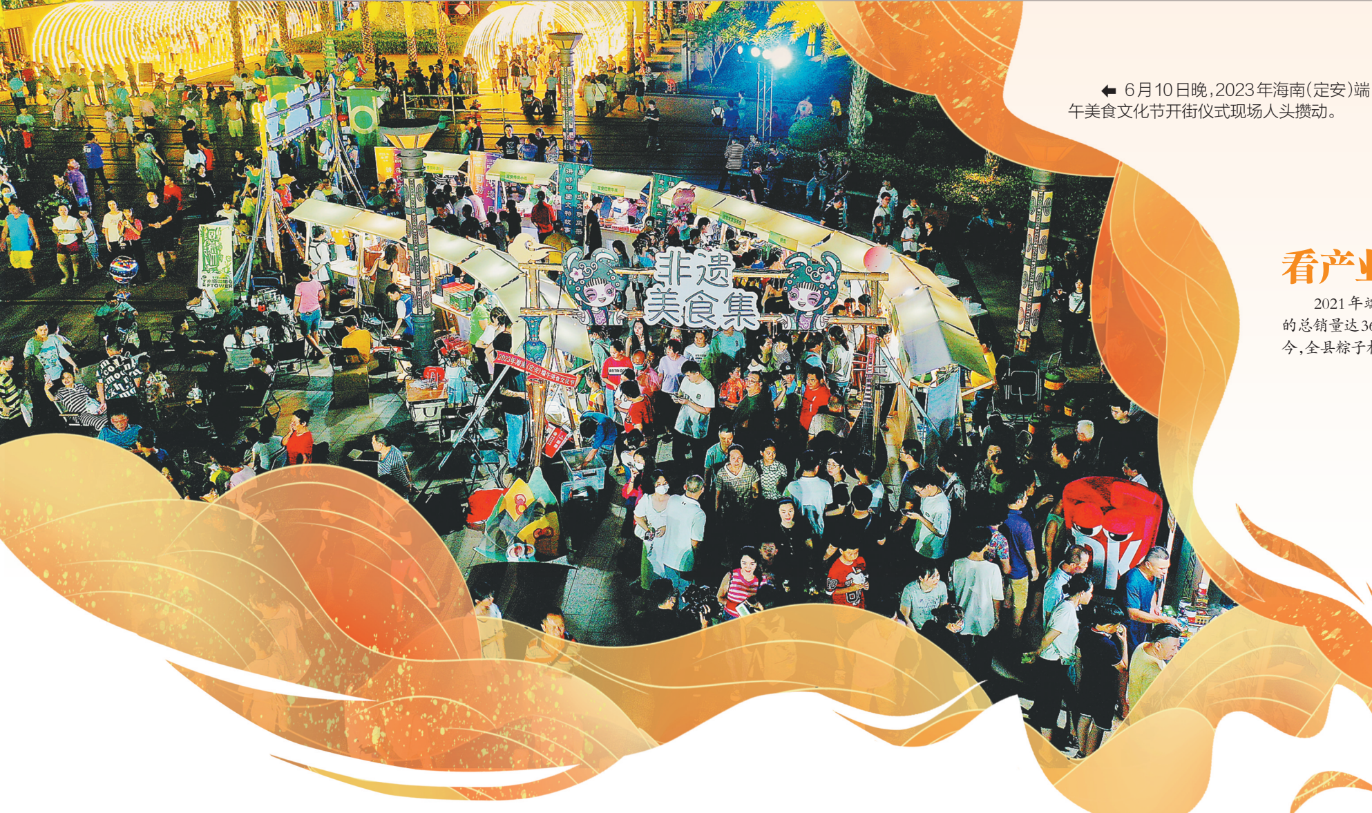
← 6月10日晚,2023年海南(定安)端午美食文化节开街仪式现场人头攒动。