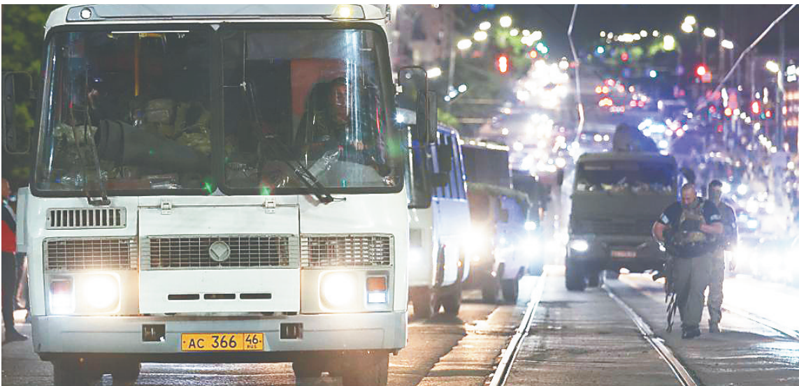
六月二十四日，在俄罗斯顿河畔罗斯托夫，瓦格纳组织车队驶过。

瓦格纳组织23日深夜涉嫌煽动叛乱，导致俄国内局势紧张。24日晚，剑拔弩张的局势走向缓和，这是如何实现的？