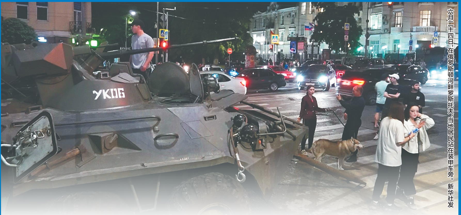
六月二十四日，在俄罗斯顿河畔罗斯托夫当地居民站在装甲车旁。