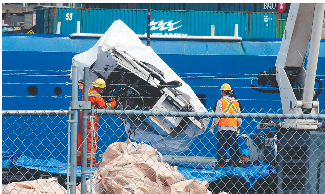
六月二十八日，在加拿大纽芬兰省圣约翰港，工作人员在卸“泰坦”号的残骸。

美国海岸警卫队28日发表声明说，近日失事的“泰坦”号深海潜水器部分残片和疑似人体遗骸已被打捞出海，并于当天送至加拿大纽芬兰省圣约翰市港口，后续将运至美国，由美国海岸警卫队组建的海事调查委员会分析检测。