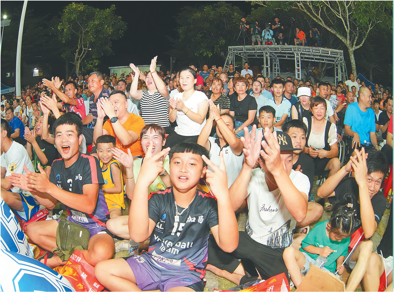
场下观众为球员的精彩表现加油喝彩，现场气氛高涨。

本报讯（记者刘宇玥 通讯员尹婉妮）近日，琼中黎族苗族自治县2023年“6·26”国际禁毒日主题晚会在营根镇三月三广场举办。 晚会中，以禁毒为主题的歌舞表演轮番上演，禁毒知识有奖问答吸引群众广泛参与。此外，琼中还对获得“全省禁毒三年大会战（2020—2022年）先进集体和先进个人”荣誉的单位和个人颁奖，推动“防毒拒毒”的观念深入人心，强化禁毒宣传。 当晚，琼中还启动海南自由贸易港封关前禁毒三年“固本防风险”行动，将做好进社区、进校园、进家庭的禁毒宣传和社区戒毒人员的统一管理。