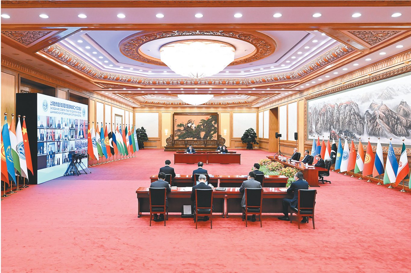
7月4日下午，国家主席习近平在北京以视频方式出席上海合作组织成员国元首理事会第二十三次会议并发表题为《牢记初心使命 坚持团结协作 实现更大发展》的重要讲话。

第一，把牢正确方向，增进团结互信。事实证明，只要我们胸怀大局，担起责任使命，排除各种干扰，就能够维护好、实现好各成员国安全和发展利益。要加强战略沟通和协作，倡导以对话消弭分歧、以合作超越竞争，切实尊重彼此核心利益和重大关切，坚定支持彼此实现发展振兴。从地区整体和长远利益出发，独立自主制定对外政策，把本国发展进步的前途命运牢