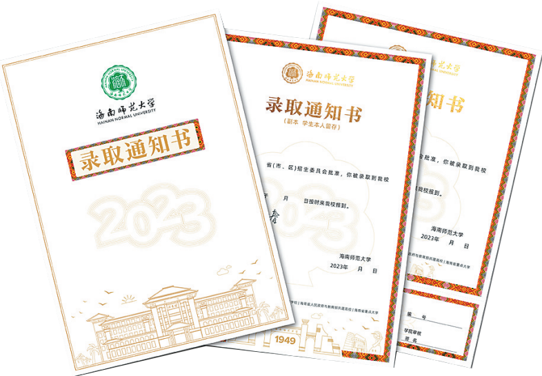
录取通知书边框融合黎锦花纹元素。

“新版录取通知书背后，寄托了学校对新生的深深期盼。”海南师范大学招生办相关负责人表示，新版通知书也像一封请柬，向四海学子发出邀请，希望新生能够从获取录取通知书的瞬间开始，融入海师这个大家庭中，在校园追逐梦想，开启新篇章。