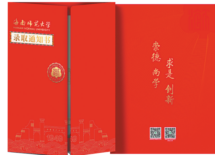
录取通知书封套。