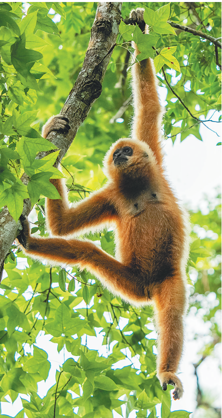
↑日前，在海南热带雨林国家公园霸王岭片区，海南长臂猿早起觅食。

本报海口7月7日讯（记者周晓梦 邵长春 实习生闫芮）7月7日，由海南国家公园研究院主办的全球长臂猿联盟第一次合作伙伴大会在海口召开。来自国内外近120名专家学者，以及15家国际组织和基金会代表齐聚一堂，共商保护长臂猿长效机制。