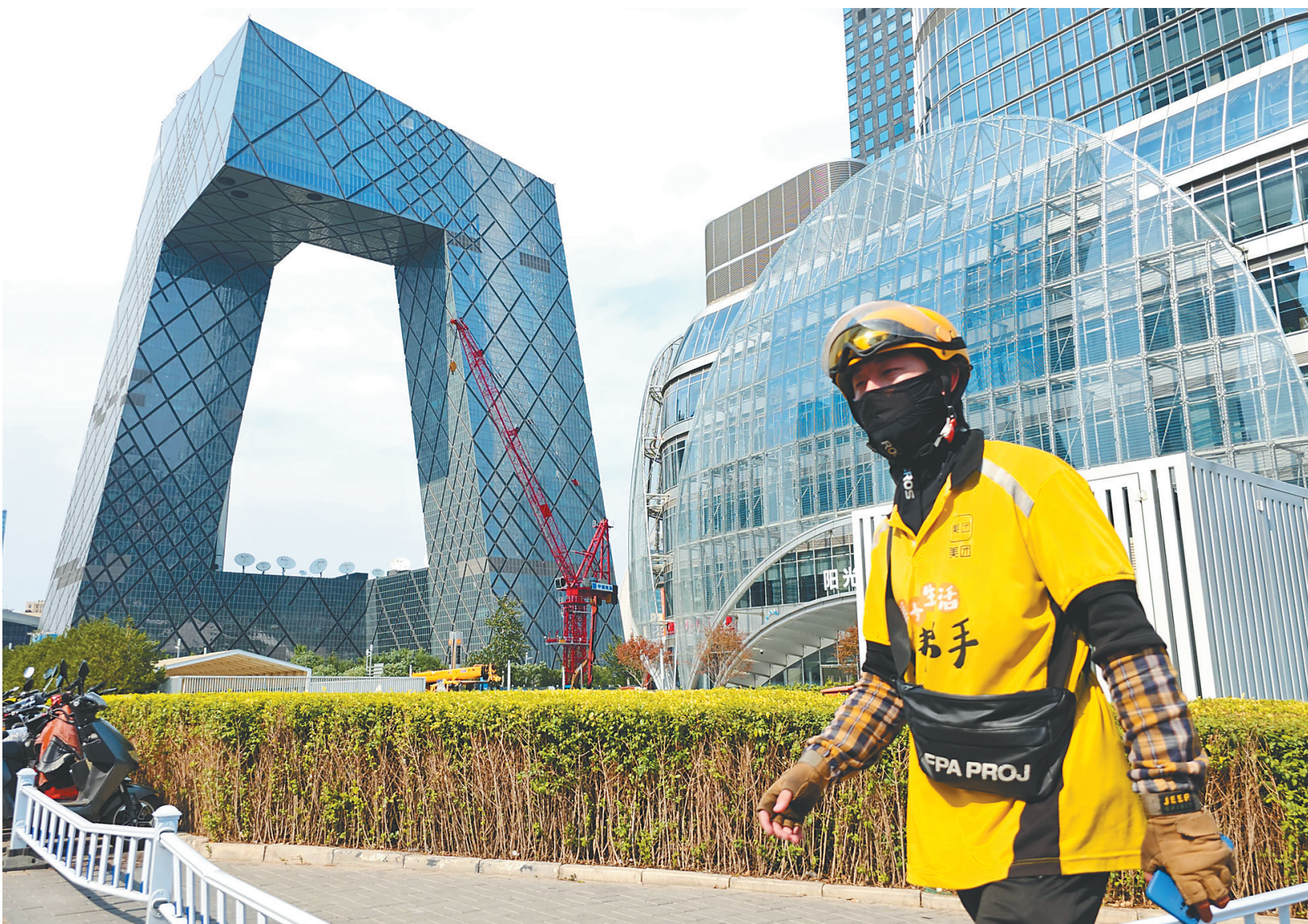
日前，一名外卖骑手在高温下的北京街头行走。

的时段也不会安排工人上岗；最高气温在35℃以上、37℃以下时，会采取换班轮休等方式，缩短工人连续作业