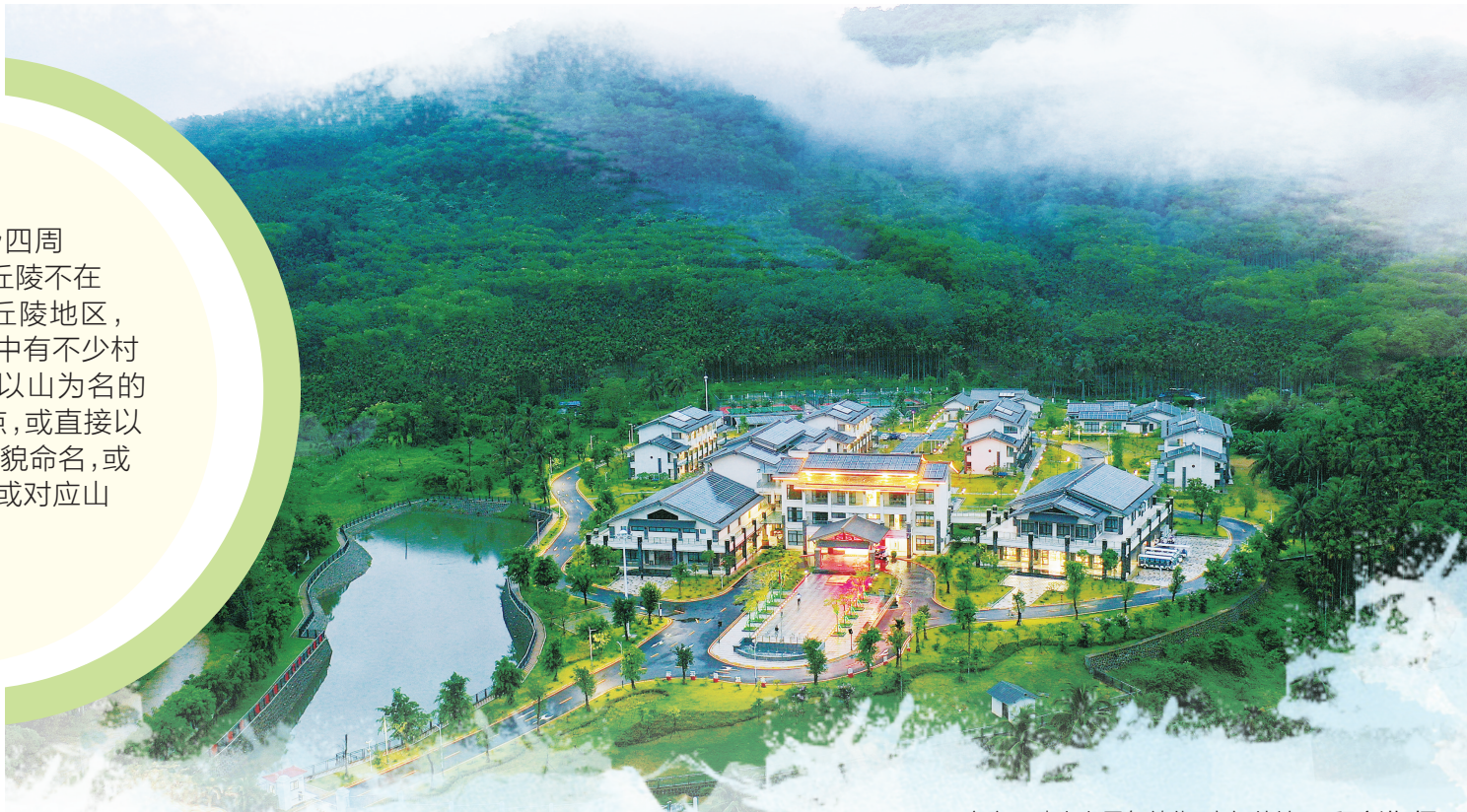
定安母瑞山上雾气缭绕,宛如仙境。

有些聚落,直接以山命名。在海口市东部,有一镇名曰“灵山镇”。灵山镇的得名,因境内有“灵山”。明正德《琼台志》记载:“灵山,俗名黑山,在县南一十五里那社都。乔木阴翳,卓有佳趣,自北渡海,至中洋即见。及抵其所,势不甚突兀,中有神祠。”历史上,灵山曾经是琼北的著名景点,是文人墨客向往的名胜,虽不高耸,但自雷州南下渡过琼州海峡,便可遥遥望见小山峰。