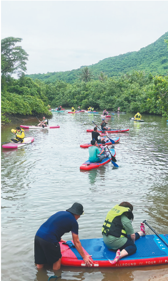
市民游客在茄新河上体验桨板。

观赏山光水色,体验田园野趣,品尝河海美味,这个目前还颇为静谧的村庄,值得想要暂时“逃离城市”的上班族一游。