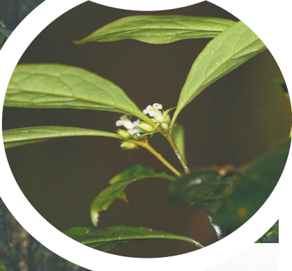
聚花海桐的花朵。