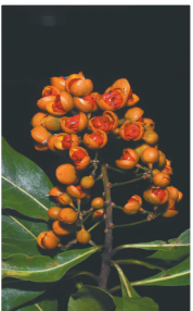
台琼海桐的果实。