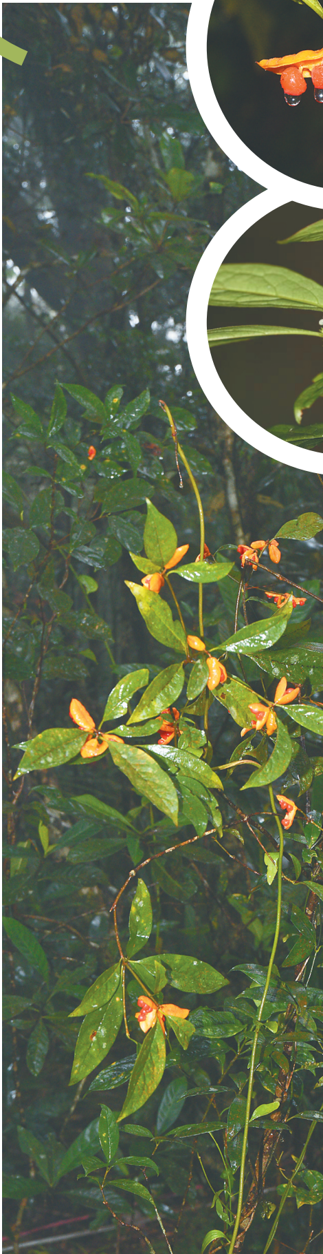
热带雨林深处的一株聚花海桐。

小暑刚过,夏意浓烈。骄阳如火,万物繁茂。 繁茂的枝条中,有这样一朵清新的小花,暗香幽来,像秋天的桂味,又像春天的山茶。然而它也只是它自己——绿色枝头的一簇簇,破壳而出的花骨朵层层叠叠,有着鲜明的橘红色,颇好辨识。这是海桐,一种在园林景观中常见到的植物,却鲜有人能叫出其名字。 它的枝条努力向上伸展,枝条的顶端就是花朵绽放的地方,秀丽的气质一览无余。