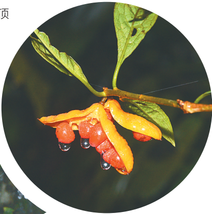
聚花海桐成熟的果实。