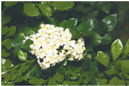
九里香的花朵。

由于长相相似,海桐经常被称作“七里香”。实际上真正的“七里香”的正式中文名是九里香。不过,这也侧面说明海桐花具有让人难以忘怀的香味。这也说明,海桐花和“七里香”,也就是九里香的花长得也有相似之处。