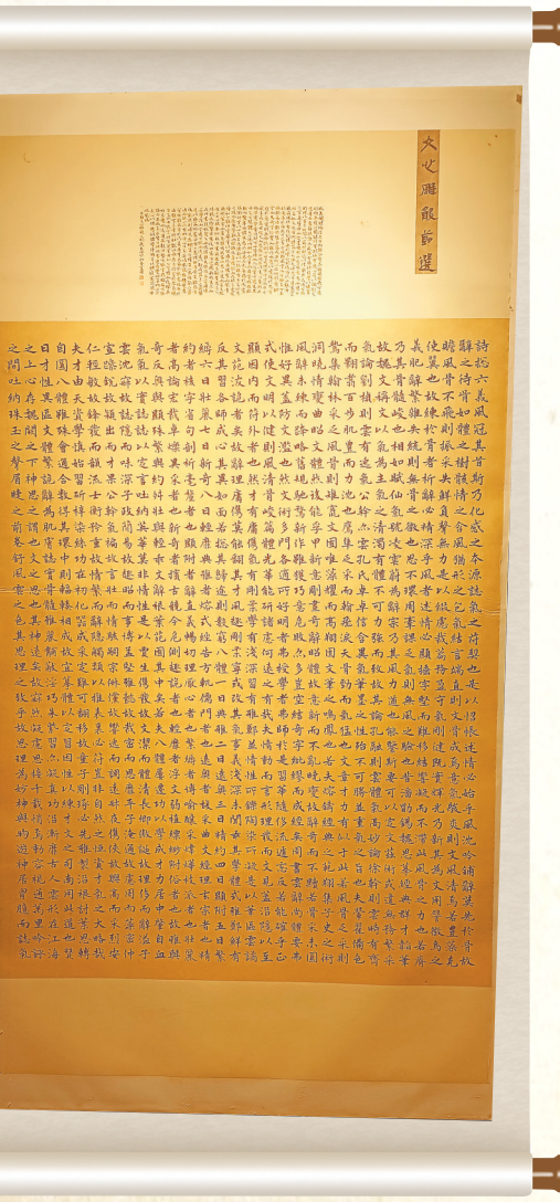
盖熠中楷《文心雕龙节选》

“通过全国性、国际性的书法艺术活动，充分利用书法艺术独特的传媒优势，讲述海南故事，传播海南文化，提升海南自贸港的文化内涵，为大力提升海南自贸港的文化软实力贡献厚重的文艺力量。”吴东民说。