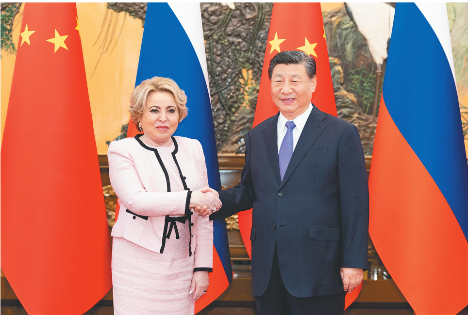
7月10日下午，国家主席习近平在北京人民大会堂会见俄罗斯联邦委员会主席马特维延科。

新华社北京7月10日电（记者郑明达）国家主席习近平7月10日下午在人民大会堂会见俄罗斯联邦委员会主席马特维延科。