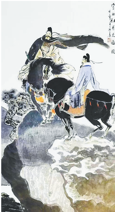
李白杜甫交游图。赵仁年 绘 本版图片除署名外均为资料图