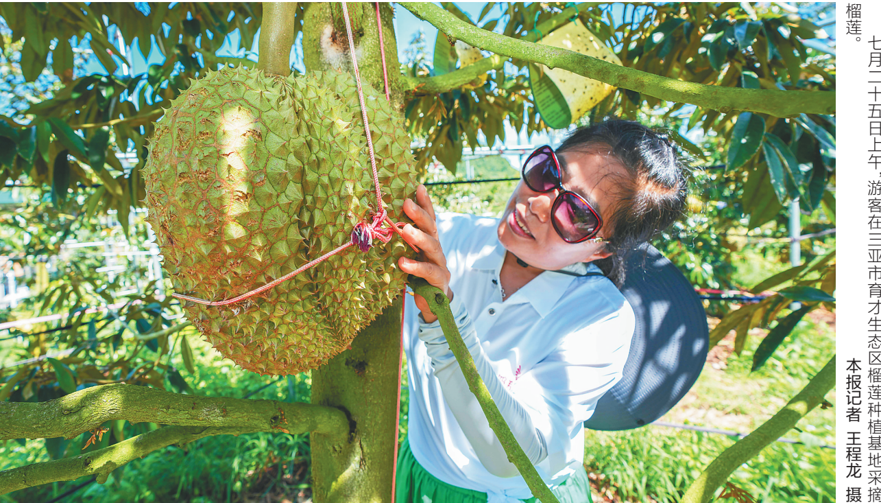
七月二十五日上午，游客在三亚市育才生态区榴莲种植基地采摘榴莲。