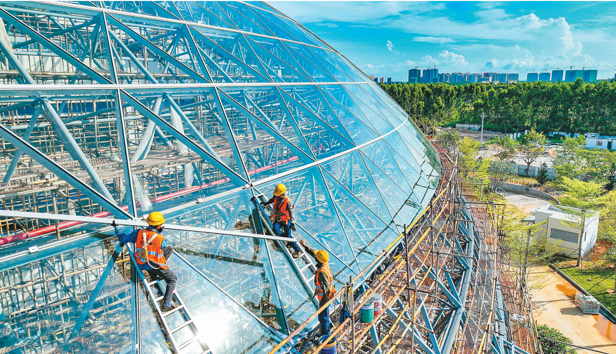
7月26日,儋州市滨海新区医院项目工地,工人正在进行高空作业。目前,项目已完成总进度的90%。据了解,儋州市滨海新区医院规划占地面积153亩,设置500张床位,将建设成为具备康复治疗功能的三级甲等综合医院。

本报海口7月26日讯(记者陈蔚林)7月26日,省政府召开专题会议,听取“诚信海南”建设和数据共享工作进展、研究部署下一阶段工作。 省长刘小明主持会议。 会议指出,推进“诚信海南”建设和数据共享工作,是推动全岛封关运作、打造一流营商环境的制度性、基础性工作。要进一步增强责任感、紧迫感,持续强化顶层设计,抓紧研究制定制度性、技术性文件,确保有法规、有制度、有计划、有安排、有督导,行业信用体系越做越好,监管和服务越来越有成效,市场主体越来越满意,形成良性循环。要深入推进信用监管,扩大“双随机、一公开”的使用范围,充分实施信用监管,推行更多跨行业、跨领域的联合监管,不断提升监管的能力和水平。要履行厅局主体责任,抓住应用场景建设“牛鼻子”,抓紧谋划申报应用场景,让平台越用越顺手、越用越省事。要更加注重诚信政府建设,完善政府诚信履约机制,引导公职人员带头守约定、讲信用。要强化责任落实,形成推进合力,实事求是补短板堵漏洞,明确数据共享“一把手”负责制,在“会共享、愿共享、实际共享”上下功夫,全力以赴确保数据能共享的都共享。要敢于走别人没有走过的路,抓紧梳理职责、系统、数据,尽快完成“三率”关联,加快提升“三率”水平。要加强信用库建设,提升实战化水平,进一步完善“诚信海南”信用体系,更好服务于全岛封关运作、营商环境建设、企业监管和人员管理。要提升数据归集质量,做到“目录之外无数据、平台之外无系统”,加快推进数据整合共享,提升数据资源利用率。要加大宣传引导力度,营造全社会共同推进“诚信海南”建设的的良好氛围。 副省长顾刚,省政府秘书长符宣朝参加会议。