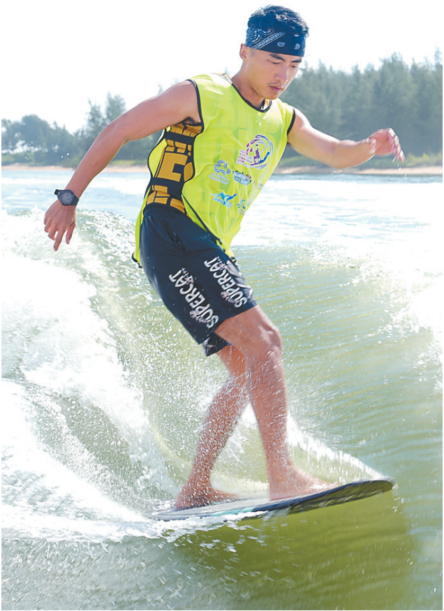
↑ 琼海博鳌,专业爱好者参与全民健身大众滑水体验季活动。