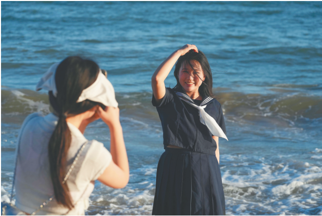
游客在三亚天涯小镇海边拍照。