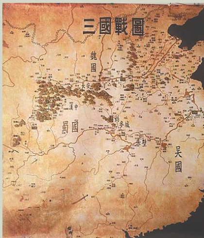
三国战图。本版图片均为资料图