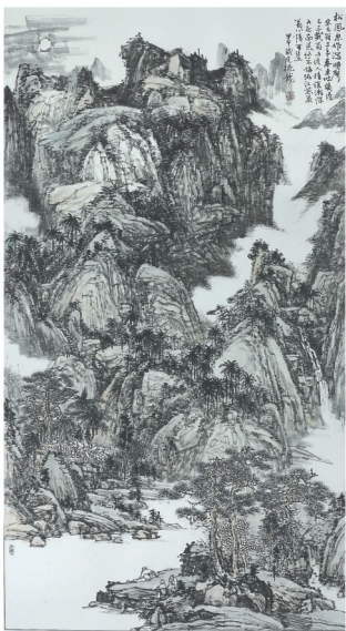
乔德龙《东坡诗意·松风忽作泻时声》。