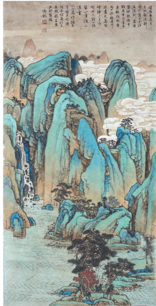
乔德龙《东坡词意·且陶陶乐尽天真》。