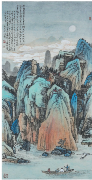
乔德龙《重游赤壁赋》。