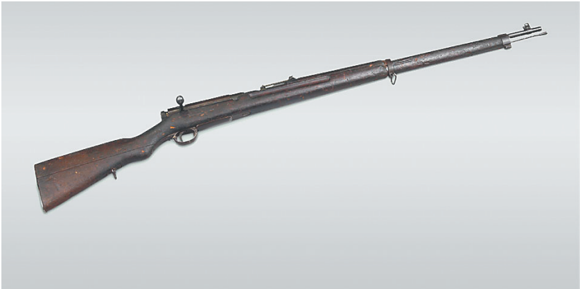
三八式步枪。本版图片均为资料图

从1942年5月开始,日伪纠集重兵对我抗日根据地进行规模空前的“蚕食”和“扫荡”,斗争环境日益恶劣。驻定安的日军为加强对内洞山一带的控制,在居丁墟建立了一个据点,并派驻了一个班的兵力,由一名曹长(上士军衔,一般相当于班长)辖治。日军时常到居丁墟周边村庄搜捕抗日人士,杀害无辜群众。一天清晨,日军突然闯进位于居丁墟西侧约1公里的外园村,把抓到的10多名无辜群众押到村子西边的