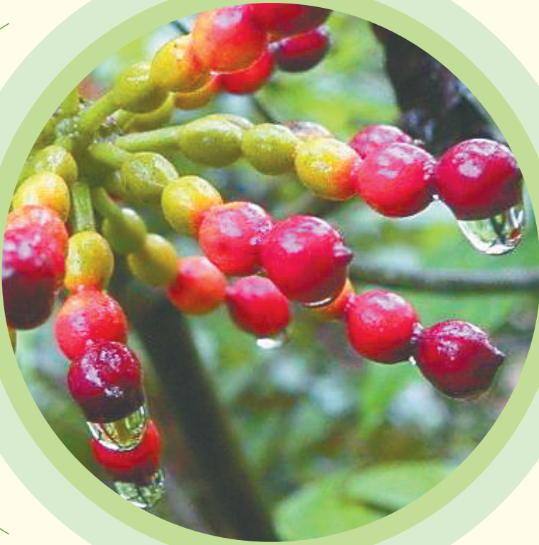
假鹰爪果实成熟后变为深红色。 资料图