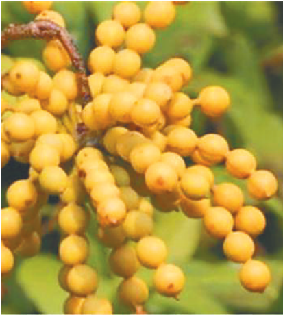
假鹰爪果序呈念珠状,像一串串冰糖葫芦。 资料图

作为番荔枝科直立或攀援状灌木,其枝条柔软披散,长椭圆形的纸质叶片葱郁钝圆。当生长的环境缺乏光照时,假鹰爪会攀附四周树木拓展生长空间,在探寻光的路上,它的枝叶与别的植物交错混杂,掩映在翠绿的枝叶中,稍不注意可能就会与之擦肩而过。