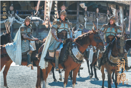
本文配图为《封神第一部：朝歌风云》海报和剧照

据介绍，主创团队计划用三部曲的形式演绎封神故事，《封神》为《封神三部曲》的开篇之作。总的来说，《封神》为国产魔幻电影点亮了一盏明灯，希望更多魔幻类影片在其基础上能更进一步，创造出一个更加璀璨的封神IP世界。■