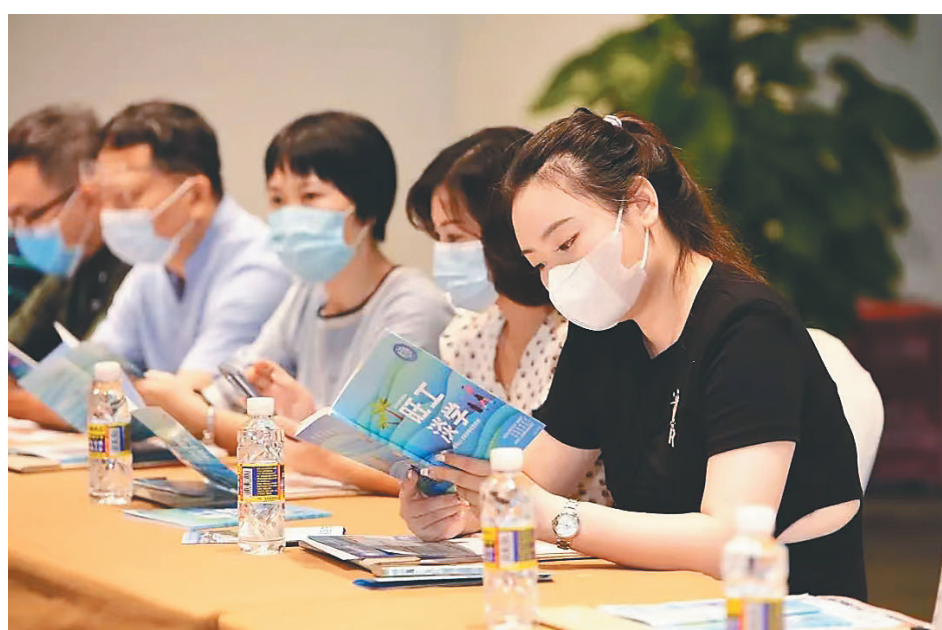
我省旅游企业代表翻阅“旺工淡学”项目宣传册。

省旅文厅相关负责人介绍，“旺工淡学”项目走出海南，是在向全国释放海南海求旅游人才的信号。同时，“旺工淡学”项目作为人才使用和培养的创新机制，省外省内两手抓，从政策和渠道共同发力，能提高项目影响力和知晓率，为海南与省外旅游人才培养搭建起资源共享、优势互补的合作平台，建立健全人才互动培养机制。