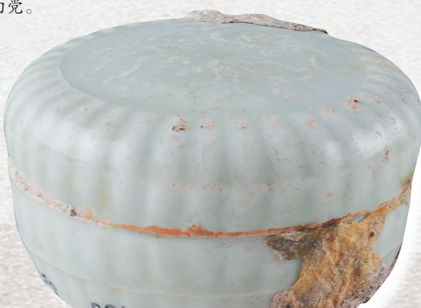
南宋青白釉菊瓣纹印花粉盒。