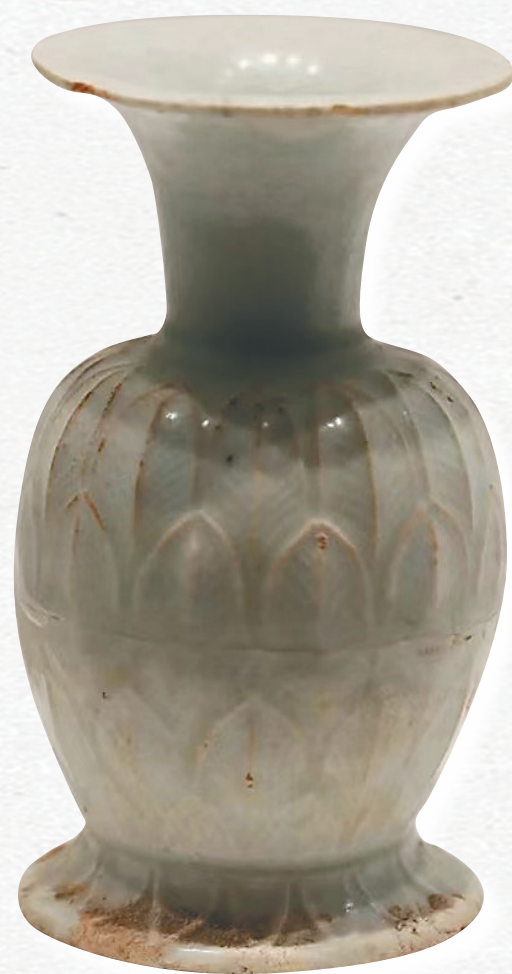
中国国家博物馆藏清白釉莲瓣纹长颈瓶。

海南地处南疆，孤悬海外，因特殊的地理环境和气候条件，古时便有许多珍奇物产作为土贡之用，这其中以黄梨梨和沉香最负盛名。从海隅深山的林木变为宫廷家具和文房雅玩，它们脱离了自然属性，增加了人文气息，成为清雅绝尘的象征。因不少是宫廷御用，明清之际的黄梨梨和沉香木制品以故宫博物院所藏最为精绝。