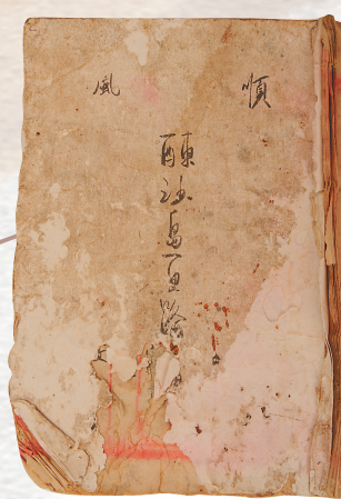
清《顺风东西沙岛更路簿》。

登山采玉、入海求珠。2022年8月11日，国家版本馆发布公告，自发布之日起面向全社会长期开展版本征集工作，征集范围包括出版物、革命文献、历史文献、实物版本、印刷型版本、邮政版本等十大版本类型，广泛搜罗古今中外载有中华文明印记、文化符号、文脉信息的版本资源，力求“收百世之阙文，采千载之遗韵”。我们期待将来有更多海南版本资源走进国家版本馆这个文化殿堂，生动讲述过去，有力影响当下，深刻昭示未来，为世界读懂海南、读懂中国打开一扇扇窗口。