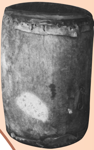
白沙起义群众用过的战鼓。