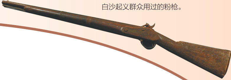
白沙起义群众用过的粉枪。