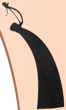
白沙起义群众用过的牛角号。