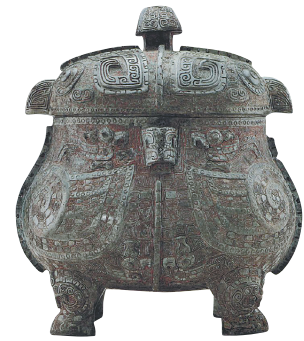
商晚期铜鸮卣(美国弗利尔美术馆藏)。