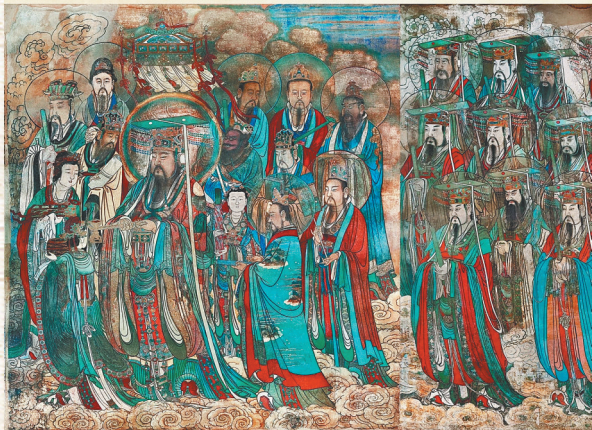
元代永乐宫壁画《朝元图》(局部)。