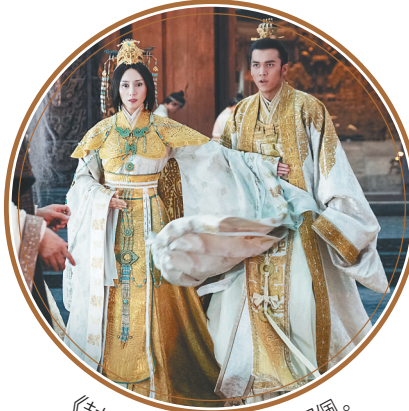
《封神》中,姜王后佩戴玉组佩。