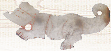
◀商晚期虎形玉佩(山东滕州前掌大墓地出土)。 ↓商晚期龙形玦(安阳殷墟妇好墓出土)。

殷寿成为商王进行祭祀时,曾手握玉钺。钺在商周时期是权力的象征。另外,西伯侯姬昌曾赠其子姬发一枚玉环,其寓意是希望身为商纣质子的姬发可以早日还家。《荀子·大略》中载:“绝人以袂,反绝以环”,意思是说断绝君臣关系时赠以“袂”,重新召回被贬谪的臣属则用“环”,应是取两者的谐音“决”和“还”。电影中,姬昌也是从玉环认出了姬发。这枚玉环可以说是姬发与姬昌父子关系的纽带,又是影片的最后姬发回到西岐的点睛呼应之物。