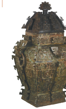
商代方血罍(湖南博物馆藏)。

目前,影片《封神第一部》(以下简称《封神》)正在各大影院热映。它取材于明代神魔小说《封神演义》和宋元话本《武王伐纣平话》,讲述了商与西岐大战之前的传奇故事。作为一部神魔史诗,震撼恢弘的视觉特效自然可圈可点,更为观众称道的是其独具匠心的服装道具,其中包含的不少历史元素均取材于真实文物,不仅有商周青铜器、玉石器,还有唐代的坐龙、元代永乐宫壁画等。文物元素贯穿影片始终,在剧情之外,成为一道独特的风景线。