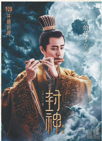
《封神》中,伯邑考吹奏竹篴。本版图片为资料图

此前,曾有媒体报道称“《封神第一部》里的埙和编钟就是参考仿制了妇好墓里出土文物的形制”。其实,妇好墓中并未发现出土编钟,倒是出土了成组的编铎。这篇报道的受访者可能是将铎看成了钟。两者虽都为打击乐器,形制有相似之处,但铎一般形制上比钟相对更宽,常口朝上手持敲击;钟则是口朝下、悬挂在钟架上进行敲击。图