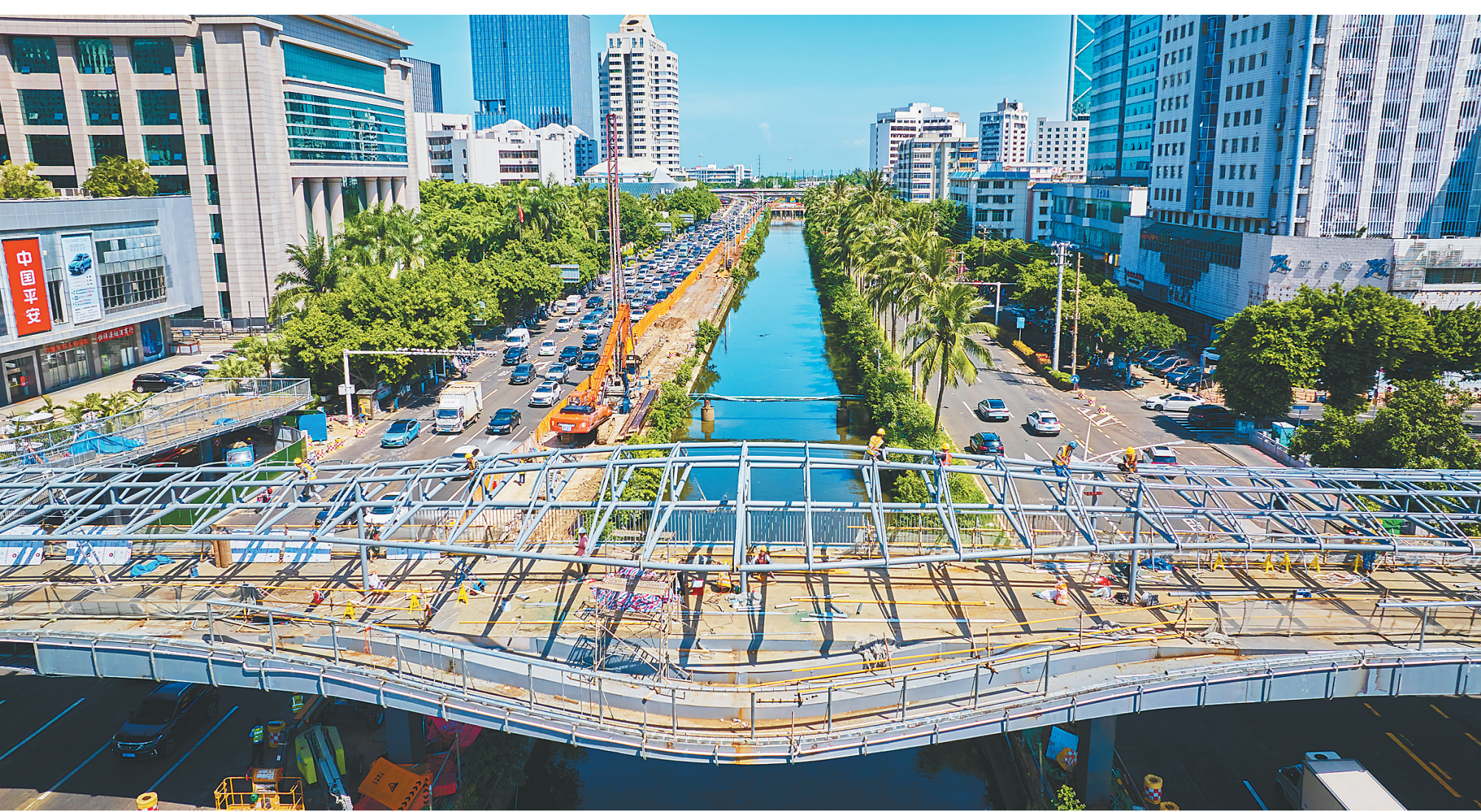
国贸路天桥展新颜

本报讯 (记者刘婧妹 特约记者符文倩 通讯员刘天升)近日,昌江黎族自治县2023年国家开发银行生源地信用助学贷款受理工作已启动,助学贷款最高申请额度为1.6万元。 日前,海南日报记者在县教育局办公楼一楼生源地助学贷款办理窗口前看到,工作人员正在为前来办理助学贷款的学生和家长提供咨询、引导服务,有序进行资格审查、网上注册、合同签订等流程。 生源地信用助学贷款的对象是家庭经济困难的大学生,全日制本专科生每人每年可申请贷款额度不超过1.2万元,全日制研究生每人每年可申请贷款额度不超过1.6万元。 近年来,昌江不断完善学生资助政策体系,全面落实国家“应贷尽贷”政策,不断创新工作思路,积极优化贷款工作办理流程,落实远程线上办理、电子化合同签订等提高办贷效率。今年,昌江生源地信用助学贷款受理时间为7月19日至9月13日。其中,续贷学生原则上以远程电子化方式开展受理工作,首贷学生以现场电子化方式开展受理工作。