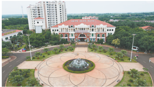
澄迈福山风情小镇。