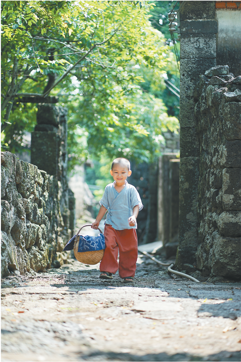
一位小朋友行走在海口三卿村的石板路上。

相传明代时此地山林繁茂，如森林之山，“森山”由此得来。清代时，人们将“森山”改为“福山”，寓意此处为福气环绕之地，这一地名也沿用至今。