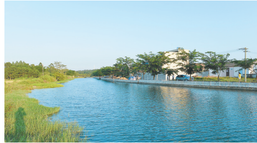
澄迈县瑞溪镇美丽的田园风光。

瑞溪镇位于澄迈县东部，南渡江穿境而过。瑞溪镇旧称“崩溪”，清代时曾是米谷交易的一个兴盛场所，是个古老而繁荣的乡镇小集。清嘉庆《澄迈县志》有记载：“瑞溪市，旧名崩溪，在曾家西都大江边，为米谷所聚之处。”