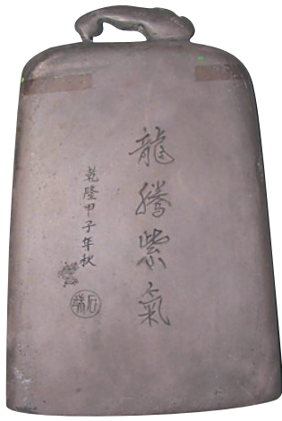
清代龙腾紫气端砚。