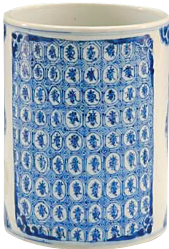
清代青花开光花卉纹寿字笔筒。

为了让作业本和卷面干净整洁,现在有不少学生使用橡皮擦、涂改液、修正胶带等。很多人不知道的是,古时也有功能类似的修改工具。在以竹简为书的年代,古代读书人一般会在案头放一把书刀。书刀通常是用铁片做成的小刀,一旦写错字,伏案者便将其取来,把错字刮掉,然后重新写。周