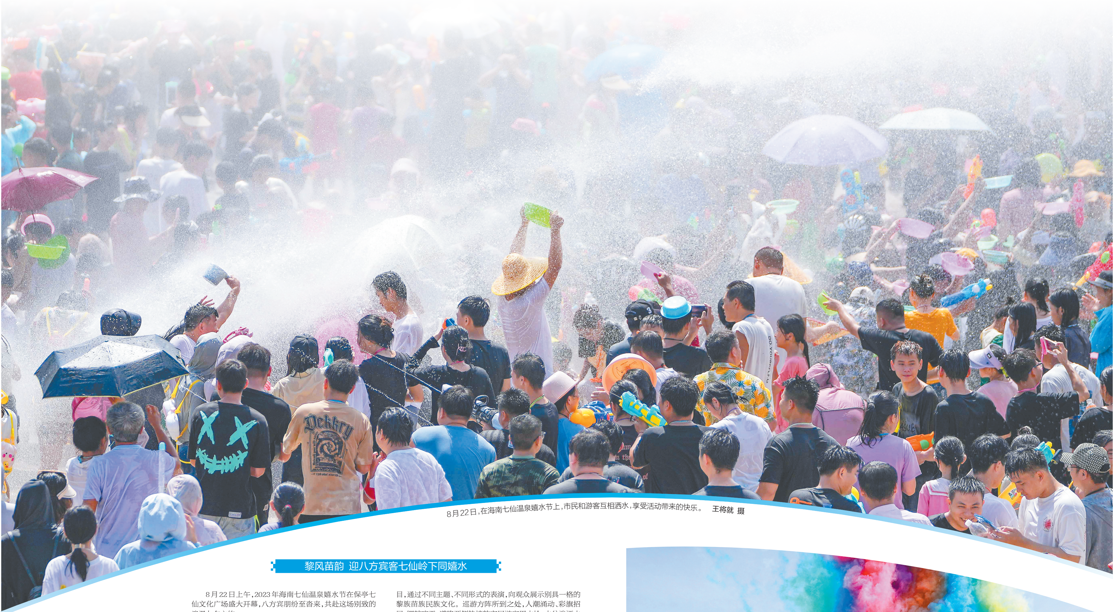
8月22日,在海南七仙温泉嬉水节上,市民和游客互相洒水,享受活动带来的快乐。