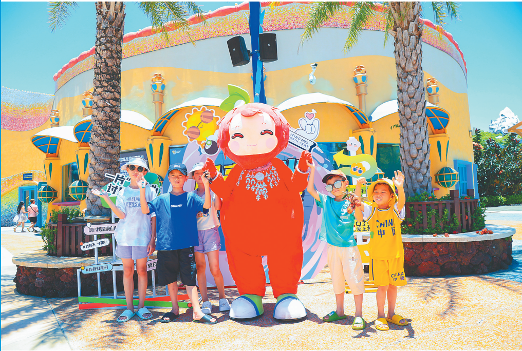
保亭红毛丹文化节吉祥物“红丹丹”与小朋友互动。