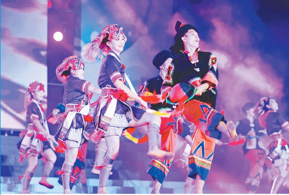
8月22日晚,“点亮夜保亭”嬉水演艺嘉年华现场演出。