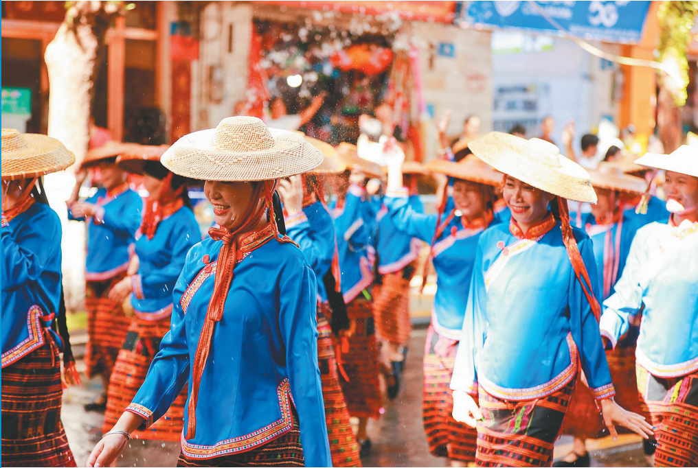
海南七仙温泉嬉水节欢乐大巡游方阵队伍身着民族盛装参加活动。