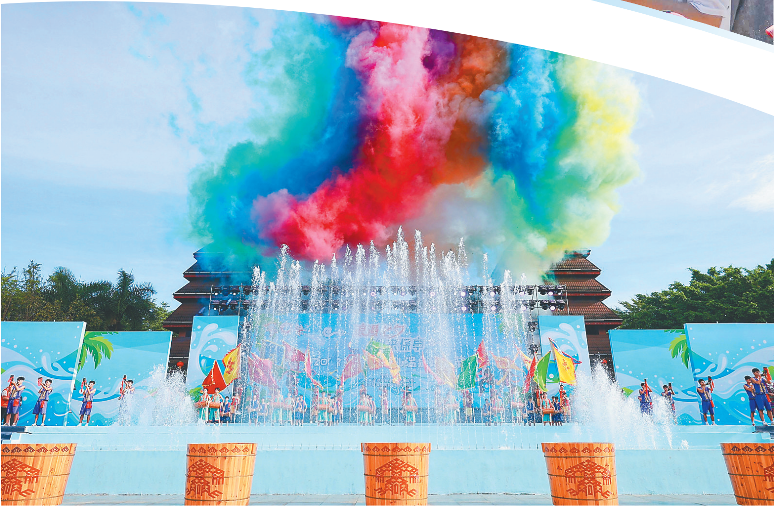
2023年海南七仙温泉嬉水节开幕式现场表演。

不久前,第二届保亭红毛丹文化节落下帷幕。近一个月的时间里,多项富有青春活力的主题活动精彩纷呈,农旅文融合让这座生态山城更添人气,保亭在这个夏天吹“破圈”吸粉。 从全岛多地“区域快闪”的寻味之旅,到夏日live歌会、青春潮玩会、青春有爱健走活动、保亭研学游等花样“主场party”活动,这些贴合年轻群体的主题活动展现了多姿多彩的“如画保亭”,市民游客在其间品尝红毛丹等当地特色美食,体味民族文化和保亭风物、生活之美。 自亮相以来,保亭旅游推荐官、保亭红毛丹文化节吉祥物“红丹丹”在多处留下足迹,传递保亭的热情好客,发出来自保亭的“邀请函”,其活泼可爱的形象深受市民游客喜爱,也让更多人了解保亭、爱上保亭。 以节为媒,保亭当地文旅消费持续火热,一条“吃、住、行、游、购、娱”的多业态产业链条被注入活力。当地旅游市场也呈现出“淡季不淡”的特点,年轻游客群体占比比较高。不仅农户吃上“旅游饭”,景区也迎来客流量高峰。以分会场槟榔谷为例,该景区嬉水节期间客流量比平日增长20%。同时主题节庆聚集的人气也反哺推动农文旅融合增效升级。 每年节庆活动期间,保亭还会推出丰富多彩的主题旅游线路和产品,集中展示独具特色的黎苗文化、雨林风光、康养资源。通过为旅游注入“文化IP”,保亭还改变以风景名胜吸引游客的模式,注入文化底蕴,打造人文景观,旨在走好这条特色化、差异化、生态化的农旅文高质量发展道路。 (撰文/春戈)