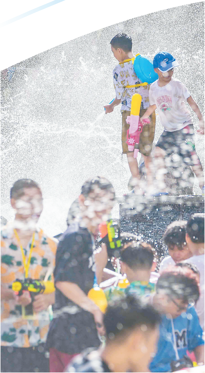
在保亭黎族苗族自治县七仙广场,小朋友在嬉水节上玩耍。

七仙岭下,水雾连天,成千上万的人们与水纵情共舞;七仙河畔,欢笑连连,远道而来的宾朋共赏黎风苗韵。刚刚结束的2023年海南七仙温泉嬉水节奏响了激情狂欢的乐章,让保亭黎族苗族自治县这座生态山城化作一片欢乐的海洋。 一个传统节庆搅热一座城,一场文旅盛会带火一座城。近一个月以来,不断升温的“烟火气”,持续升温的人流量都折射出保亭独有的活力与魅力,彰显着保亭丰富多彩的人文风情和得天独厚的旅游资源。 以节为媒,以文促旅,近年来,保亭依托特色优势资源,深度策划全年节会活动,打出一张张节庆王牌,进一步提升城市品牌形象影响力和美誉度。