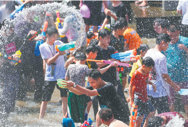
8月22日,在保亭黎族苗族自治县七仙广场上,市民游客互相泼洒寓意吉祥祝福的水。