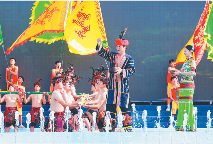
8月22日,嬉水节开幕式现场,在“长老”带领下,“七仙女”迎接“圣水”。