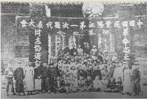
1926年国共合作时期，国民党阳江第一次县代表大会合影。