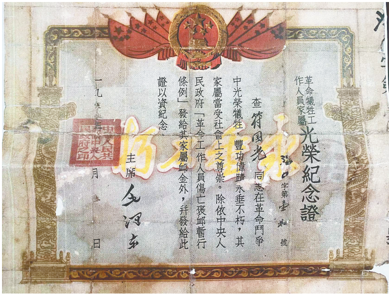
符家保存的革命牺牲工作人员家属光荣纪念证。