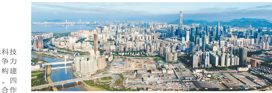
河套深港科技创新合作区深圳园区皇岗口岸片区。