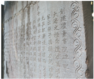
琼台书院内的石碑。资料图