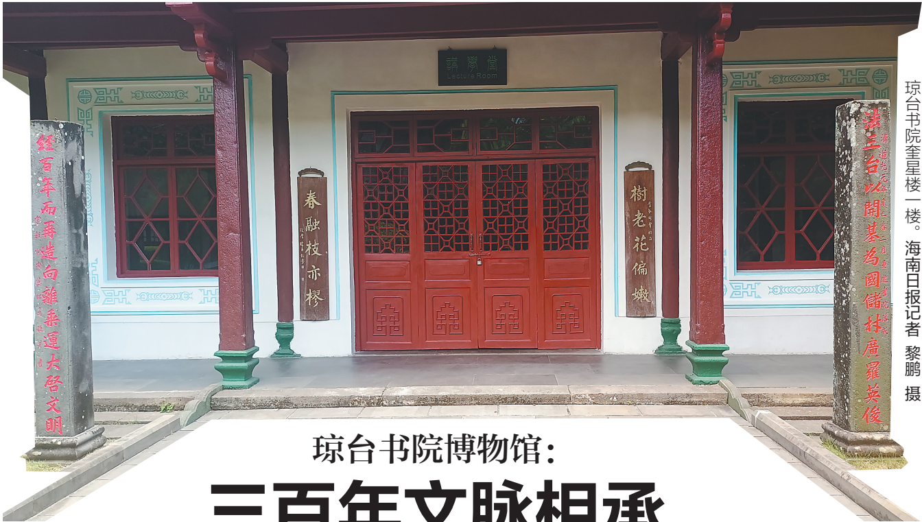
琼台书院奎星楼一楼。

充满烟火气息的府城街区，人群熙熙攘攘、车辆川流不息。虽处在一片喧闹声中，但琼台书院博物馆依然保持着沉静的气质。传承数百年琼州文脉，它用独特的历史文化魅力，滋养着每一位走近它的观众。