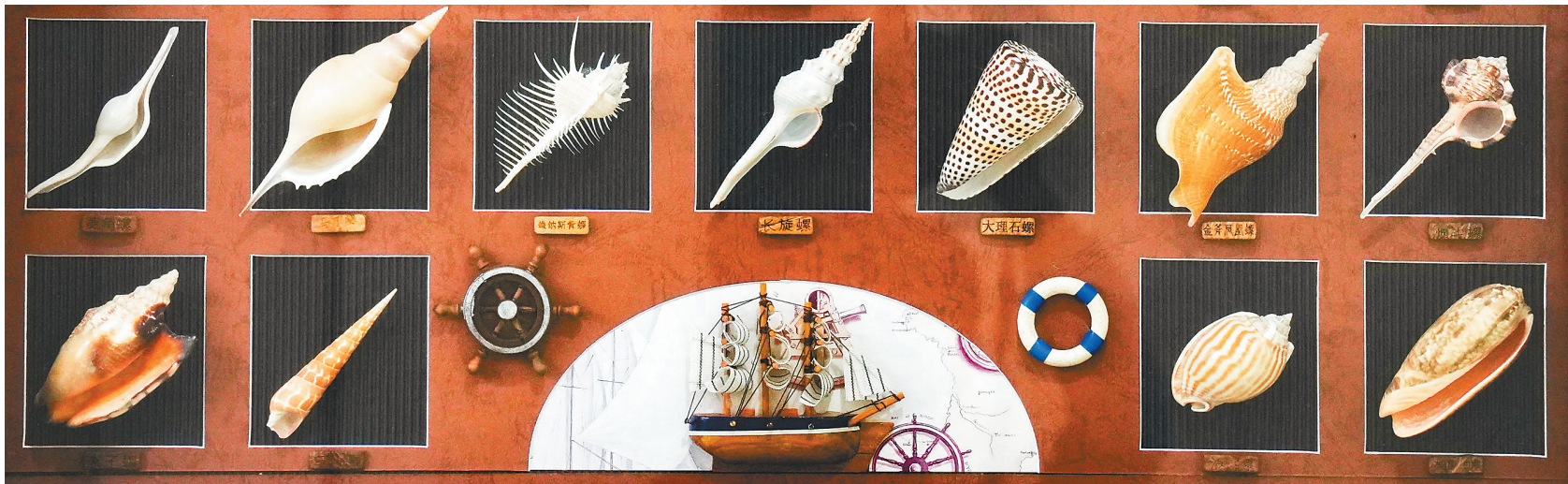
南海文化博物馆展出的螺类标本。

除了奇妙的水下世界,该博物馆还展示我国海洋科技,如船怎么吃“沙子”?水下采油树如何开展工作?有兴趣的市民游客可以去馆内寻找答案。☞