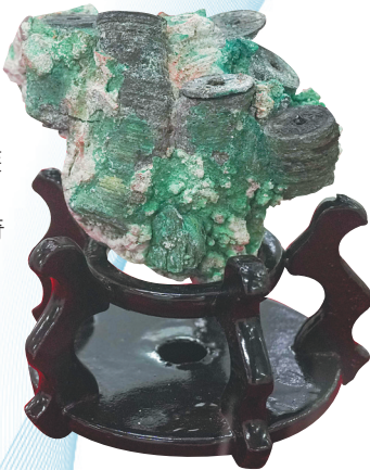
明永乐年间的铜钱。