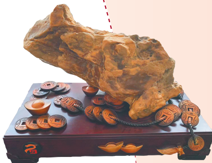
形似蟾蜍的黄蜡石作品。