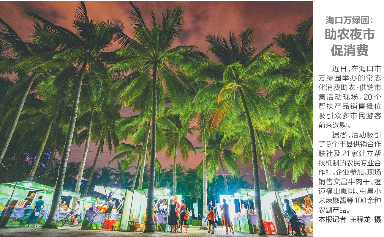
海口万绿园：助农夜市促消费

单位、中介组织、个人引进的高层次人才和团队。 协议引才奖励申报对象为具有独立法人资格及合法资质的人力资源企业，申报条件为第三方人力资源机构根据用人单位人才需求，双方签订引才协议或服务合同，引进人才与用人单位签订劳动(聘用)合同并到岗工作，缴纳3个月及以上社保或个税，次年申报期开始时仍在岗的，人力资源机构可于次年引才奖励申报期内申请相应引才奖励。