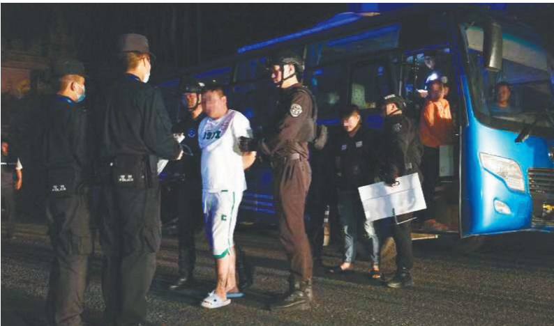
图为犯罪嫌疑人移交中方。

新华社北京9月5日电（记者任沁沁 熊丰）记者5日从公安部获悉,9月3日,在公安部和云南省公安厅的组织部署下,西双版纳公安机关依托边境警务执法合作机制,与缅甸相关地方执法部门开展联合打击行动,一举打掉盘踞在缅北的电信网络诈骗窝点11个,抓获电信网络诈骗犯罪嫌疑人269名。 此次抓获的电信网络诈骗犯罪嫌疑人中,中国籍186名、缅甸籍66名、越南籍15名、马来西亚籍2名,幕后“金主”、组织头目和骨干21名,网上在逃人员13名,包括1名潜逃19年的命案在逃人员。现场查获电脑、手机、手机卡、银行卡和诈骗话术脚本等一大批作案工具。目前,中国籍犯罪嫌疑人已移交我方,公安机关将彻查其违法犯罪事实,依法予以严惩。 今年以来,缅北涉我电信网络诈