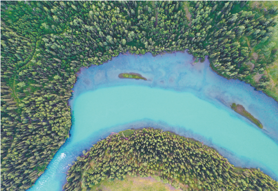
新疆阿勒泰地区喀纳斯景区风光（无人机照片）。

很多国内外的案例都表明，通过音乐推广城市文化和旅游目的地能够产生积极的效果。天津商业大学宝德学院副教授李彬彬也曾做过一个关于“因歌出游”的调研，她说：“音乐的叙事传输正向影响着人们对歌中所提及旅游目的地的选择倾向。音乐这一独特的魅力媒介，能够让旅游目的地借助音乐的翅膀飞到更多角落，令旅游目的地更有名气、个性更鲜明、更有吸引力。”