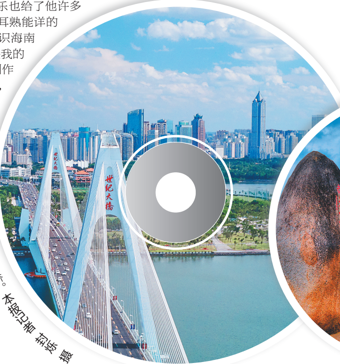
海口世纪大桥。

乐天坦言，在创作过程中，《请到天涯海角来》《万泉河水清又清》等经典的海南音乐也给了他许多创作灵感，“这些耳熟能详的音乐是我最早认识海南的一扇窗口，也是我的音乐启蒙师，在创作《听见·海南》时，熟悉的旋律在心中响起，更让我感受到一代代音乐人的传承力量。”