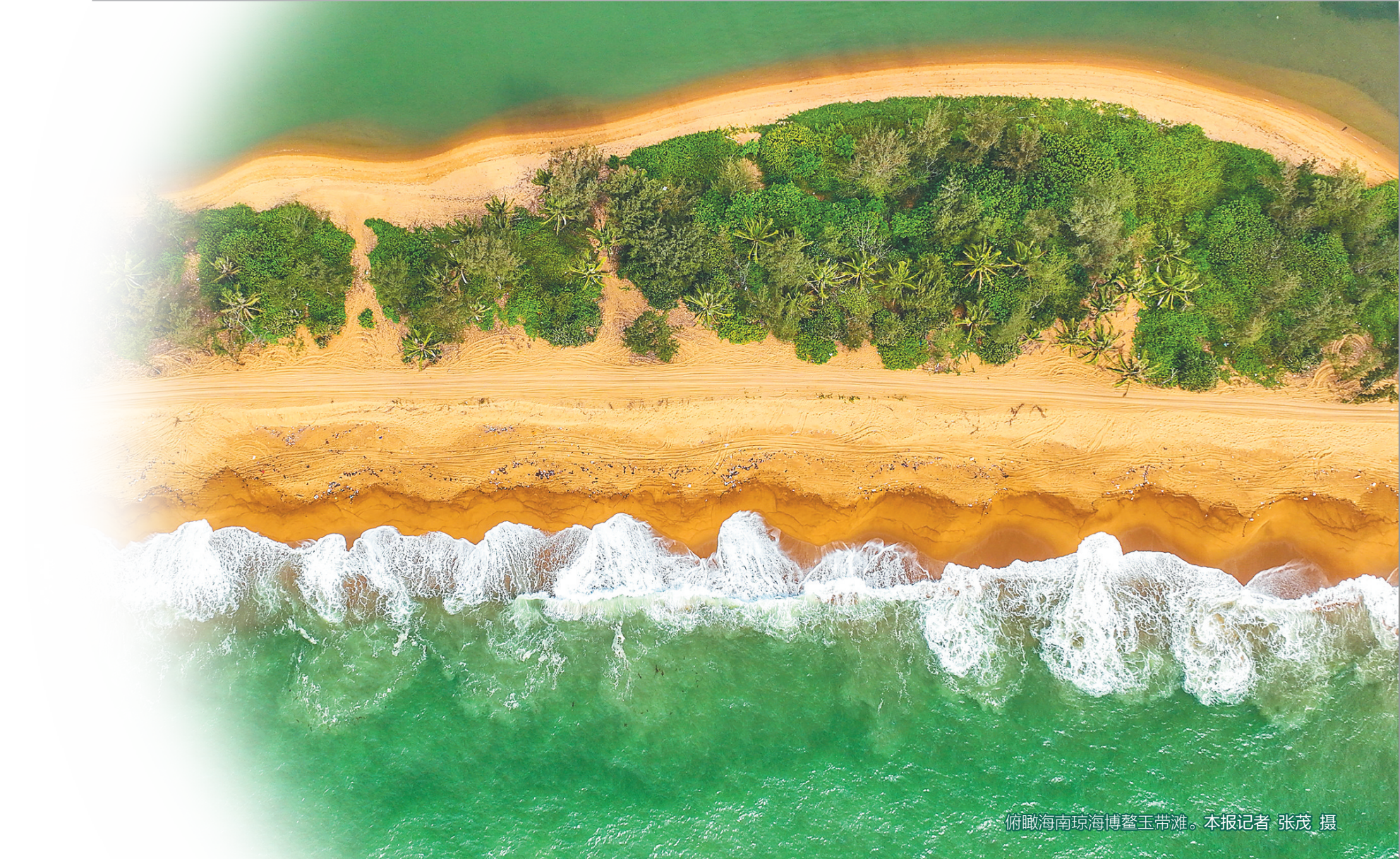
俯瞰海南琼海博鳌玉带滩。本报记者 张茂 摄