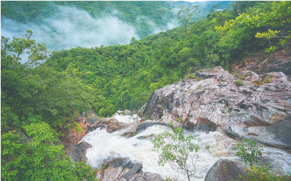
9月6日,大雨过后,海南热带雨林国家公园霸王岭片区云雾蒸腾。

走访霸王岭、尖峰岭、五指山等地,围绕生物多样性保护、生态科研监测、“绿水青山就是金山银山”实现路径、资源调查、生态搬迁等方面开展集中采访。 海南省林业局(海南热带雨林国家公园管理局)党组书记、局长刘钊军表示,希望通过主题采访,全方位、多角度、多渠道地报道海南热带雨林国家公园建设成效,将雨林之美、雨林的秘展示给全球受众,提升公园知晓率和影响力,营造人人了解、热爱、参与海南热带雨林国家公园建设的良好氛围。 据了解,近年来,海南热带雨林国家公园在管理体制机制、生态保护修复、科技支撑保障等方面不断探索创新,取得了一些阶段性成效。通过国家公园建设,将空间让给雨林的诺言正在逐步兑现,海南热带雨林生态系统多样性、稳定性、持续性不断提升,园区生态环境持续向好。