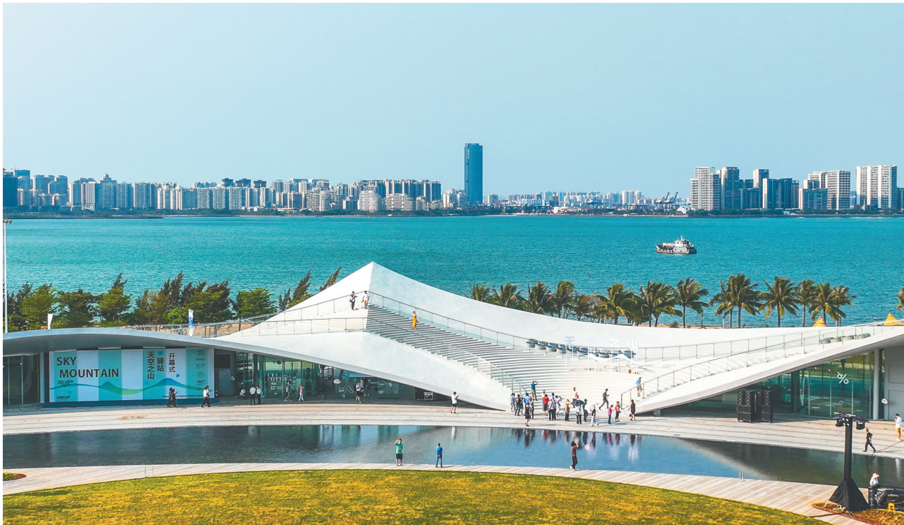
海口“天空之山”驿站内，许多市民游客在散步、观光。近年来，海口湾通过建设畅通工程，扩大生态驳岸与滨水湿地，打造优质滨水公共开放空间，“天空之山”驿站等优质亲海空间越来越多，吸引人们前来“打卡”。（资料图）