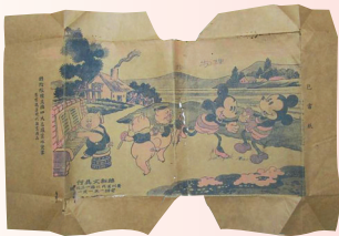
“米老鼠”主题包书纸。

包书皮，就是将书的封面和封底包裹起来以保护书籍，这种护书方式在我国可谓历史悠久。在古代，书籍十分珍贵，有的读书人会给书裹上“保护层”，材料通常为布、皮革或材质较粗糙的纸张等。再后来，除了印制好的“包书纸”，旧报纸、挂历、牛皮纸等也被人们用来包书皮。