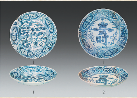
东南亚出水的青花吉祥盘。