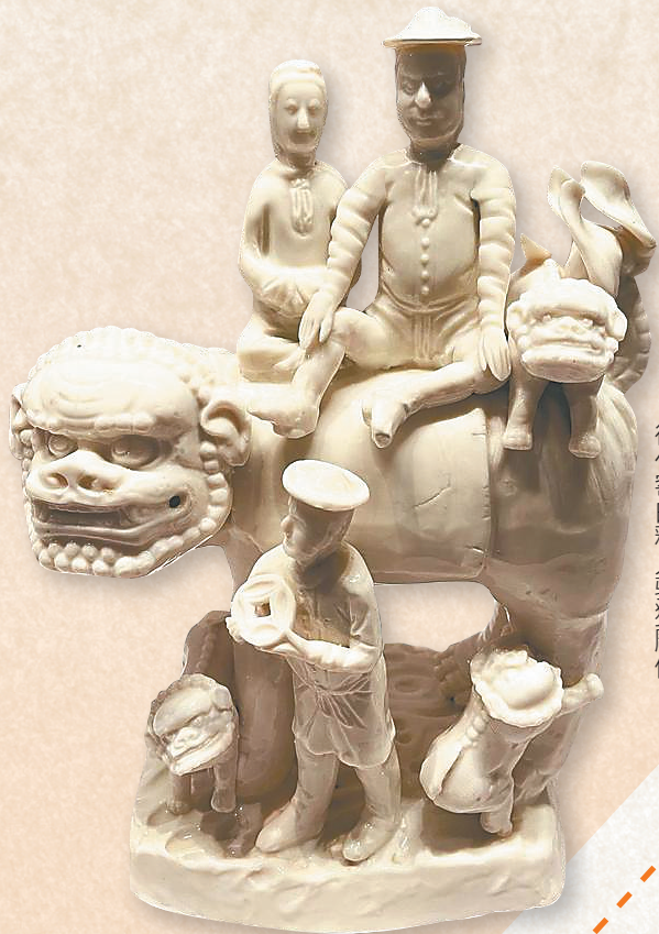
德化窑白釉人骑狮雕像。

定制鞋服、定制手机、定制家具、定制款饮料、定制化旅游产品……近年来,随着互联网技术的应用和消费升级,越来越多的定制产品和服务走进人们的生活。很多人不知道的是,“定制”其实并不是一个很新的概念,千百年前,为了迎合市场需求,古代中国的瓷器商人和烧造瓷器的窑口已将一些外国文化元素融入瓷器制作,让外销瓷呈现出一定的“定制风”。