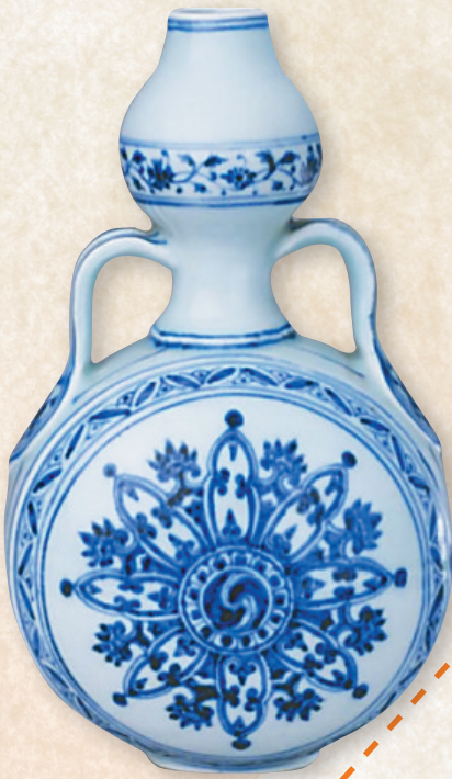
明永乐青花双耳葫芦式扁瓶。