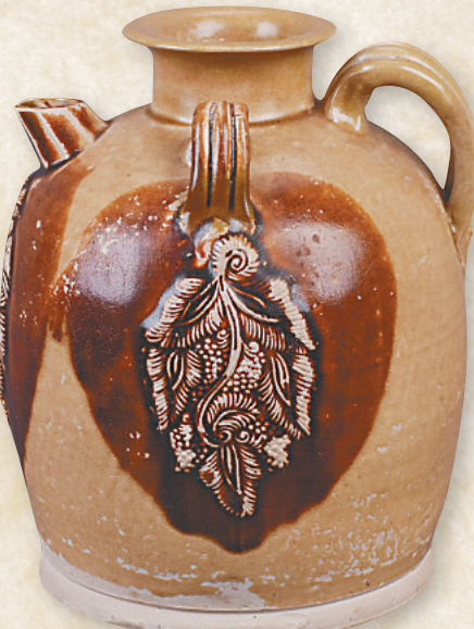
唐长沙窑青釉褐斑贴花椰枣纹瓷壶。

“黑石号”沉船出水的一批长沙窑瓷罐印有椰枣、棕榈纹饰,这较为清晰地体现出了其迎合市场需求的特点。椰枣树是阿拉伯地区特有的高大乔木,椰枣是当地的代表性食品,椰枣纹饰带有浓郁的西亚风格。另外,考古工作人员曾在长沙窑窑址采集到波斯陶碎片,为波斯商人的生活用具,这些说明唐代可能已经出现外国商人前往中国订烧瓷器的现象。此外,“黑石号”沉船中还发现了3个完整的青花瓷盘,为目前世界上罕见的唐代青花瓷完整器。